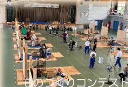
ものづくりコンテスト